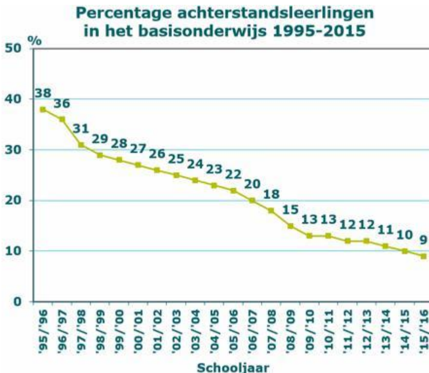
Grafico 1: Percentuale di bambini (4-12) che rientravano nei criteri di povertà educativa basandosi esclusivamente sul basso livello di istruzione dei genitori nel periodo dal 1995 al 2015.

R. In tutte le fasce di età, il numero di studenti che rientrano nei criteri di povertà educativa sta diminuendo (vedi cifre date sopra e grafici qui di seguito).