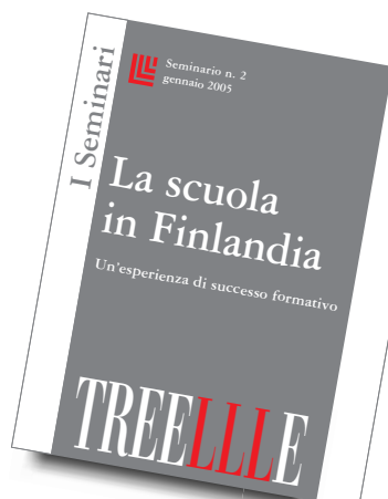
Seminario n. 2 gennaio 2005 La scuola in Finlandia