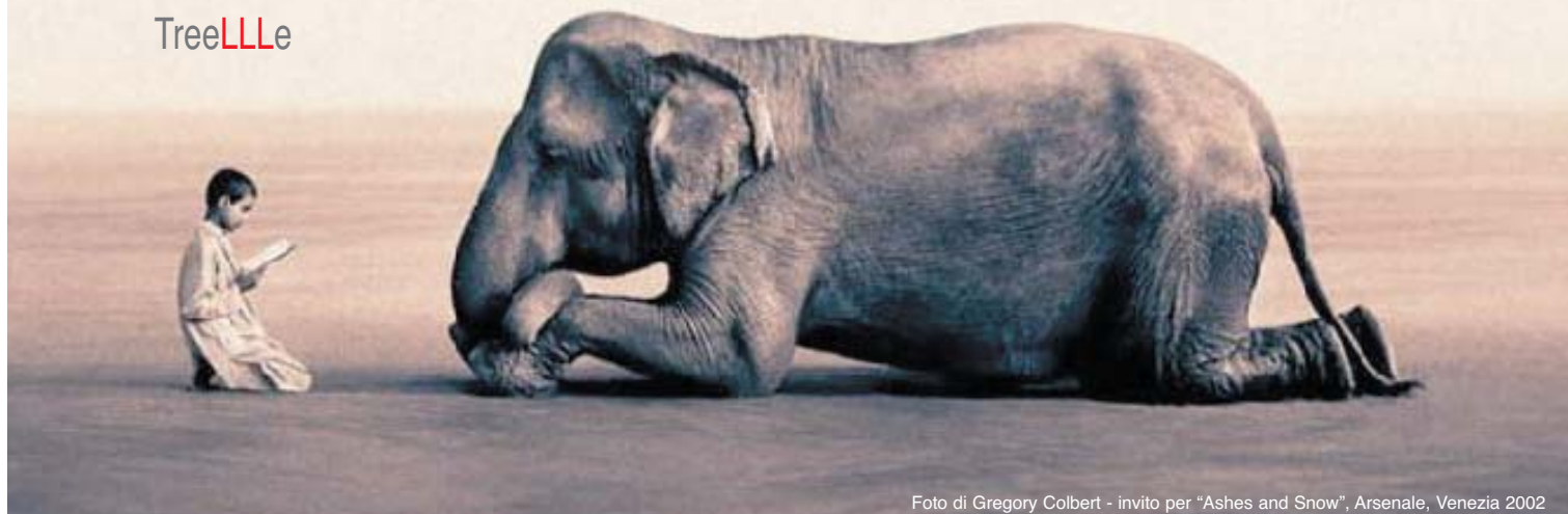
invito per "Ashes and Snow", Arsenale, Venezia 2002

Newsletter n. 2 Attività del 2005 Associazione TreeLLLe