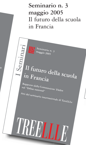
Seminario n. 3 maggio 2005 Il futuro della scuola in Francia